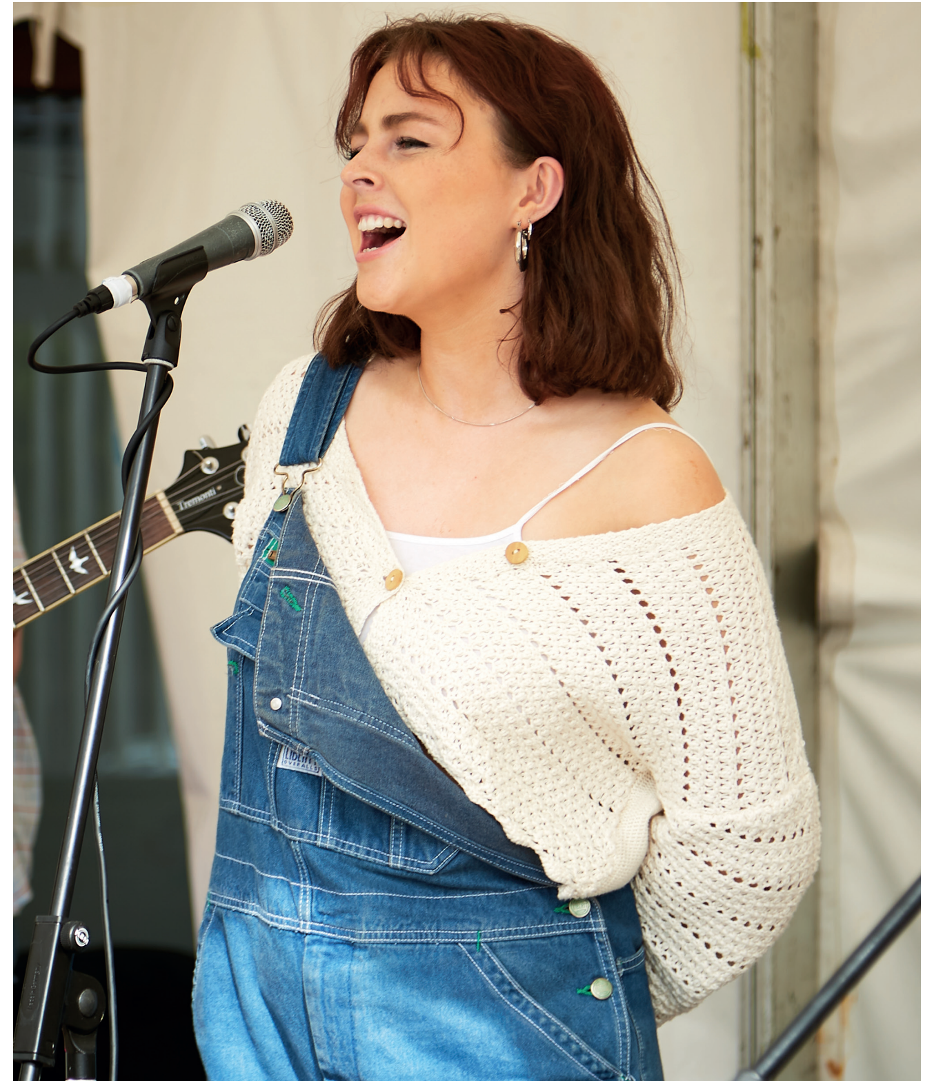
The Glens Street Session 2021

Is chun tacú le rannpháirtíocht, uilechuimsiú daoine agus iad a bheith ábalta iad féin a chur in iúl laistigh de phobail atá i gceist leis an deis a glacadh go fonnmhar i Straitéis Cultúir agus Cruthaitheachta 2023–2027 Lú agus geilleagair áitiúla cruthaitheachta a neartú tuilleadh.